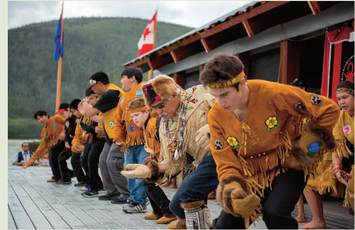
ドーソン・シティ郊外ムースハイドのフェスティバル

厳しい環境の中で狩猟生活を行い、自然を敬い、独自の文化を創り上げてきたユーコンの先住民。現在、ユーコンの全人口約44,000人のうち22%ほどを先住民が占めています。人々は、地域ごとに14の部族団体を形成。カナダ政府と協定を交わし、自治体制を整え、将来のよりよい生活にむけて環境を管理する取り組みを行っています。