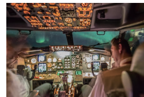
オーロラ情報を確認し飛行ルートを選択

オーロラ発生の確率が高い夜に、ジェット旅客機に乗って雲の上へ。満天の星の下、光に近づいて遊覧飛行をします。チャーターフライトによるツアーとして過去何度か実施されており、これまでのオーロラ遭遇率は100%！