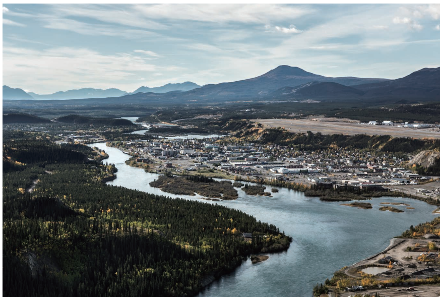
ユーコン川の畔に広がるダウンタウン

ユーコンの旅の起点となるのは、州都のホワイトホース。人口約35,000人の小さな町ですが、それでもユーコン全人口の8割ほどの人が暮らしています。ダウンタウンのすぐそばをユーコン川が流れ、雄大な大自然に囲まれており、その環境に惹かれて移り住むアウトドアファンやアーティストも少なくありません。そのせいか、町には独特の自由でクリエイティブな空気が漂っています。