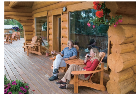
オーロラ鑑賞にも最適な自然の中の宿も

ホワイトホースには、様々なタイプの宿泊施設があり、旅のスタイルや予算に合わせて選ぶことができます。設備の調ったホテルから、手頃なゲストハウスやB&B、アクティビティを提供するロッジまで、実に豊富。オーロラを鑑賞するのにピッタリの、郊外の一軒宿なども人気です。また、自然の中での滞在を満喫できるキャンプ場も整っています。