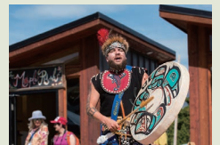
ダンスや伝統音楽の演奏も

ユーコンの部族団体の中には、自分たちのカルチャーセンターを持ち、積極的に文化紹介を行っているところも少なくありません。生活用具やアートの展示、ダンスや歌のパフォーマンス、料理やクラフトのワークショップなどは人気プログラム。伝統的なフィッシングや、アドベンチャーツアーのガイドを行う団体もあります。また一年を通じて様々なフェスティバルも各地で盛んに行われており、先住民文化に触れることのできる機会として旅行者にも人気があります。