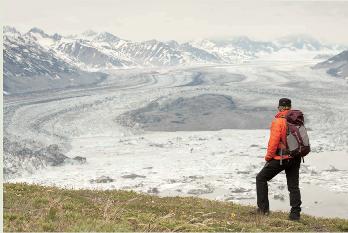
60kmもの長さで流れるローウェル氷河

カナダ最高峰のマウント・ローガン(5959m)を頂点に5000m級の山が連なる山岳地帯。周辺の山岳地帯とあわせて、世界遺産にも登録されています。高峰が連なり、長さ数十キロにも及ぶ長大な氷河の数々が流れだす、圧巻の絶景。息を飲むような自然の中、ハイキングやカヌー、ラフティングなど、本格的なアウトドア体験を。氷河上空の遊覧飛行など、アウトドアが苦手な人も楽しめるアトラクションもあります。