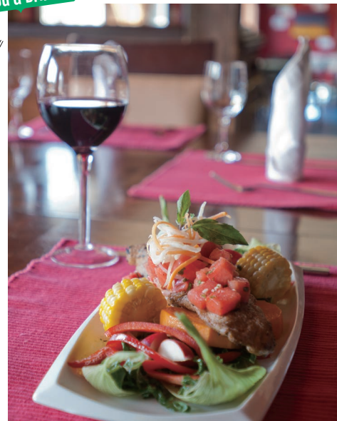
極北の町で世界の味を堪能