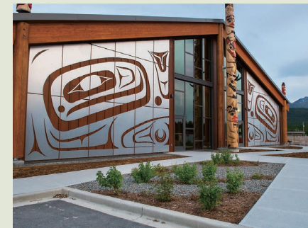
カークロスの先住民文化センター