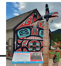
「カークロス・コムズ」では先住民文化体験も

ゴールドラッシュ時代、アラスカのスキヤグウェイとホワイトホースの間を結んでいた歴史的鉄道の、現在の東の起点となっている町が、カークロス。夏には鉄道ツアーを楽しむ旅行者で賑わいます。駅周辺にはかわいらしいホテルなどが並び、カフェやショップ、文化センターが入った「カークロス・コムズ」は人気スポット。また美しい湖が点在するサザン・レイクス地域への、ドライブ観光の拠点ともなっています。さらに近年ではマウンテンバイクの素晴らしいトレイルが整備され、アウトドアファンにも注目されています。