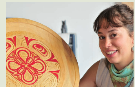
それぞれに意味が込められた動物のモチーフ

ユーコンの先住民は、身の周りの物に動物や植物などのモチーフを描き、ときにお守りとして大切にしてきました。家族のアイデンティティを示すトーテムポール、セレモニーで身につけるヘッドドレスやマスク、さらにはビーズワークのモカシンや小物入れなど、あらゆる物に自然崇拝の心が映し出されています。神秘性があり、旅のお土産としても好まれています。