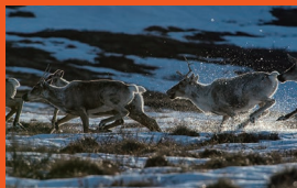
北極圏の原野を大移動するカリブーの群れ

北極海に面して広がるイバビック国立公園と、その南に隣接するプンタット国立公園は、春と秋、何十万頭ものカリブーがツンドラの大地を大移動する様子が見られる大自然地帯。いずれも、野生動物の狩猟により生活の糧を得てきた先住民文化を守るため、国立公園となった特殊なエリアです。アクセス方法は限られており、許可を得た限定的ツアーへの参加などが必要です。