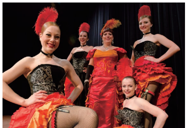
クラシックなカジノやカンカンショーも