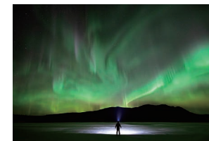
光を求めて大自然の中へ

オーロラの出現情報を確認しながら、バンなどに乗って光を追跡。見られる場所に移動して鑑賞するというアグレッシブなツアー。何もない原野や、山の麓など、鑑賞ポイントはそのとき次第で、フレキシブルに選ばれます。