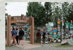
ワトソン・レイク